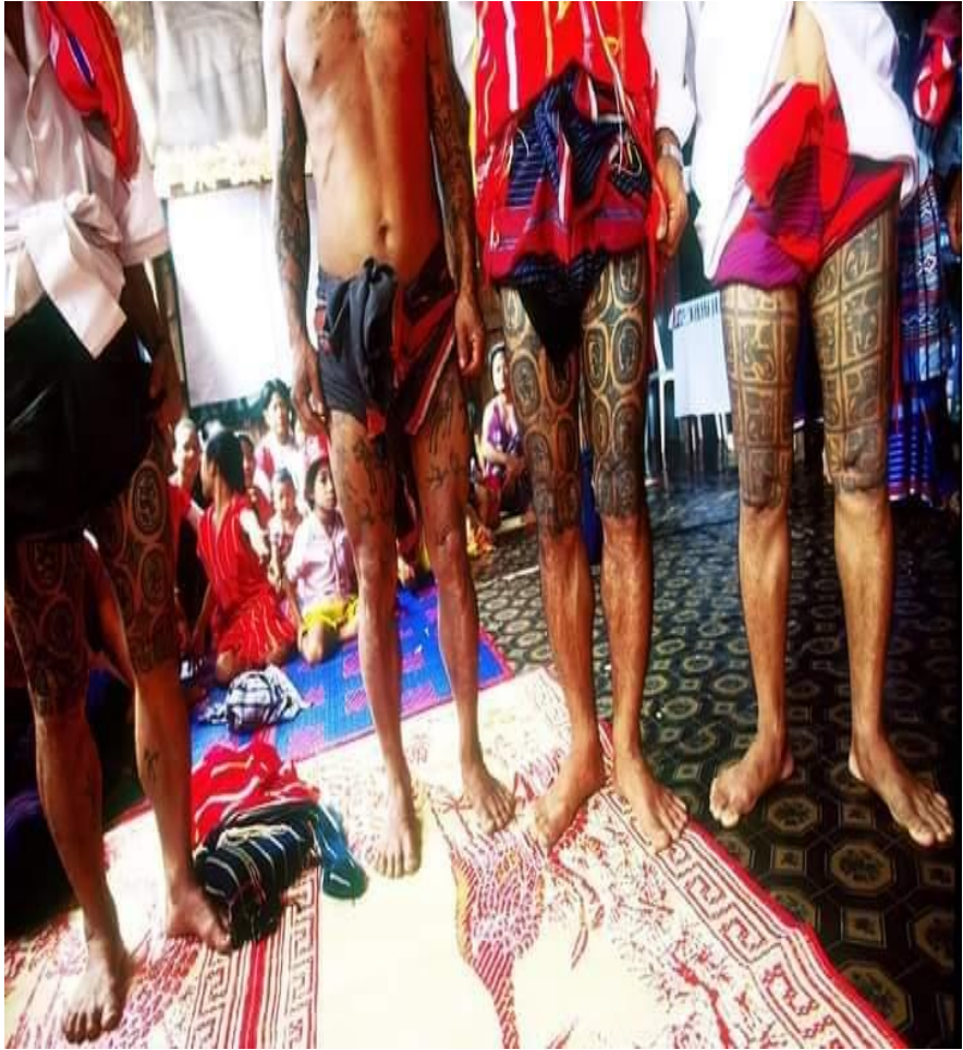
ရှေးခေတ်ကရင်ရိုးရာထိုးကွင်းမလေ့ပုံ