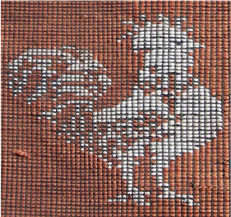
ကြက်ဖပုံဒီဇိုင်း

ဝါပင်မှဝါစေ့နှင့် ဝါပွင့်ပုံဒီဇိုင်း မိမိတို့ပတ်ဝန်းကျင်တွင် တွေ့ရတတ်သော တိရိစ္ဆာန်များဖြစ်သည့် ကြက်တူရွေး၊ ပျံလွှားငှက်၊ လိပ်ပြာပုံ၊ ကြက်ဖပုံ၊ ဆင်ပုံ၊ ဒေါင်းငှက်ပုံစံ၊ ခွေးပုံစံ၊ တီကောင်ပုံစံဒီဇိုင်း အစရှိသဖြင့် ရက်လုပ်တတ် ကြသည်။