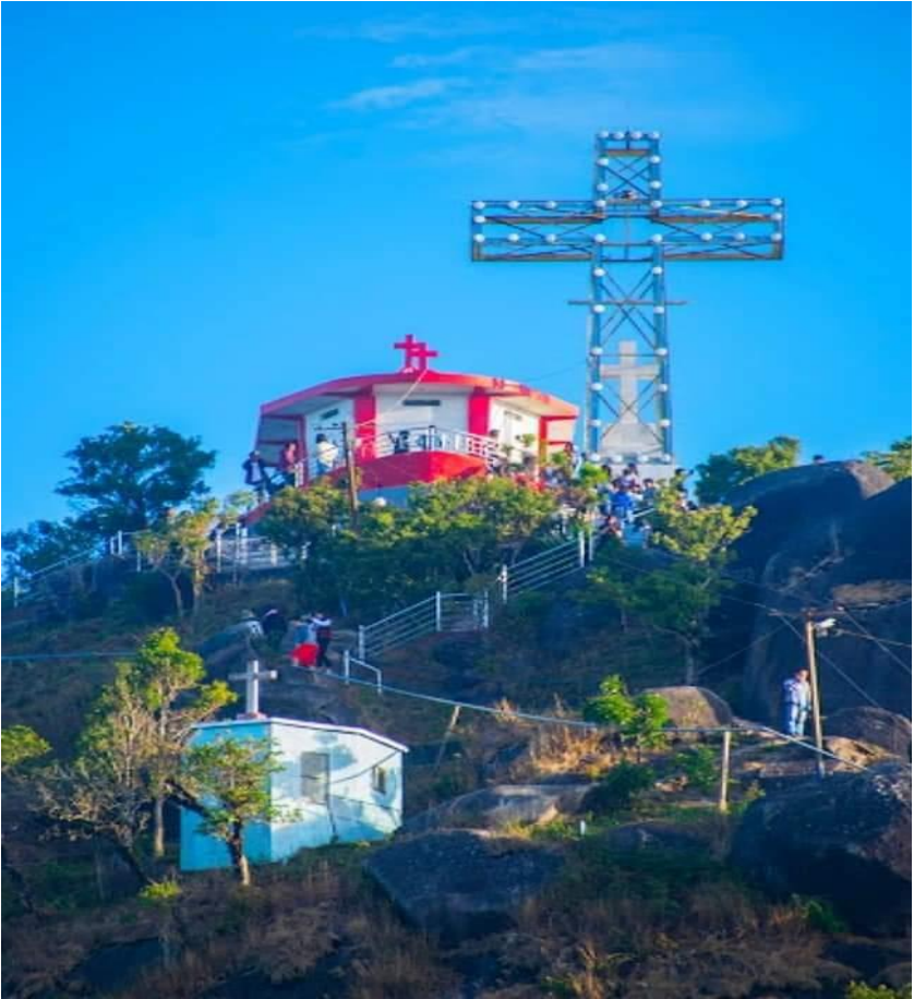
ကရင်ပြည်နယ် သံတောင်ကြီးမြို့မှ နော်ဘူဘောဆုတောင်းတောင်