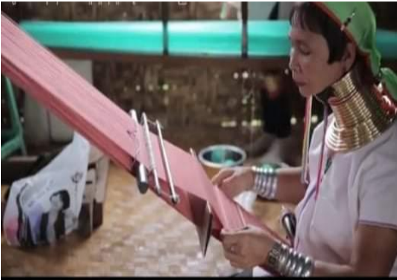
ကယန်းအမျိုးသမီးဂျပ်ခုတ်နေပုံ