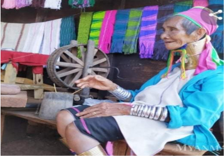
ကယန်းအမျိုးသမီးဗိုင်းငင်နေပုံ