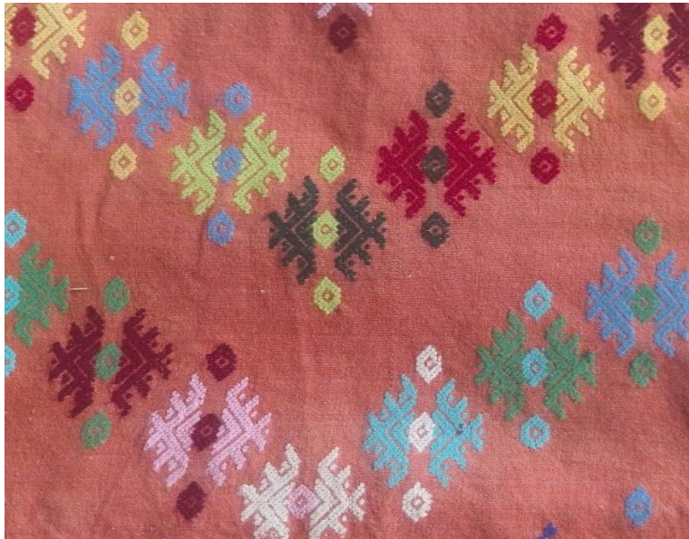
ယနေ့ပြန်လည်ဆန်းသစ်တီထွင်ထားသောဒီဇိုင်းများ