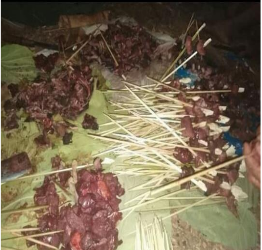
တောကောင်အသားများကို ရွာရှိအိမ်ထောင်စုများအား အချိုးကျခွဲဝေပေးနေပုံ