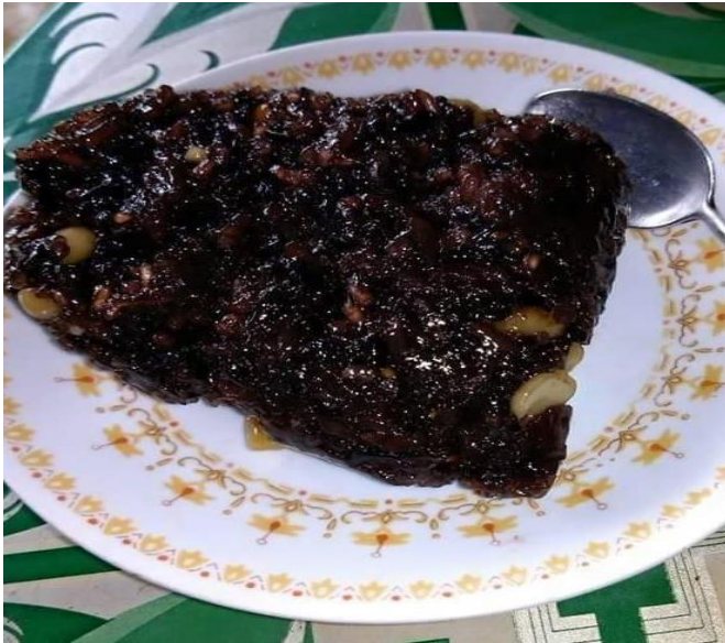
တနင်္သာရီရိုးရာရာသီစာခေါ်သရုပ်မုန့်