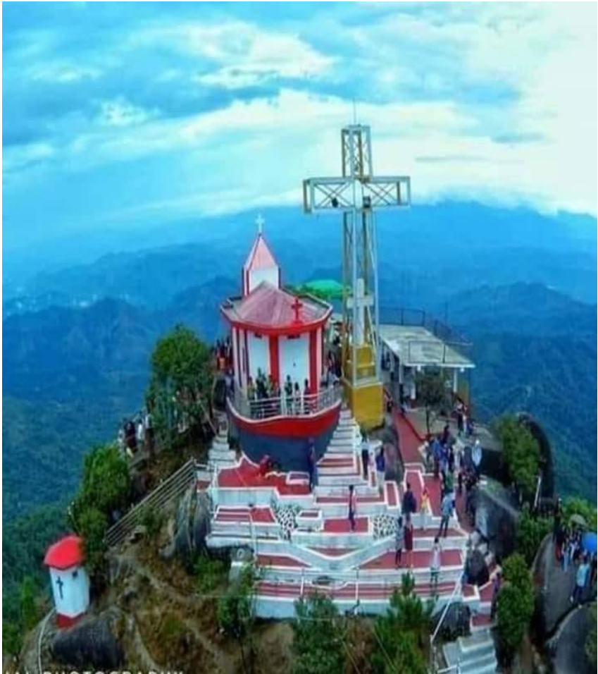
ကရင်ပြည်နယ် သံတောင်ကြီးမြို့မှ နော်ဘူဘောဆုတောင်းတောင်