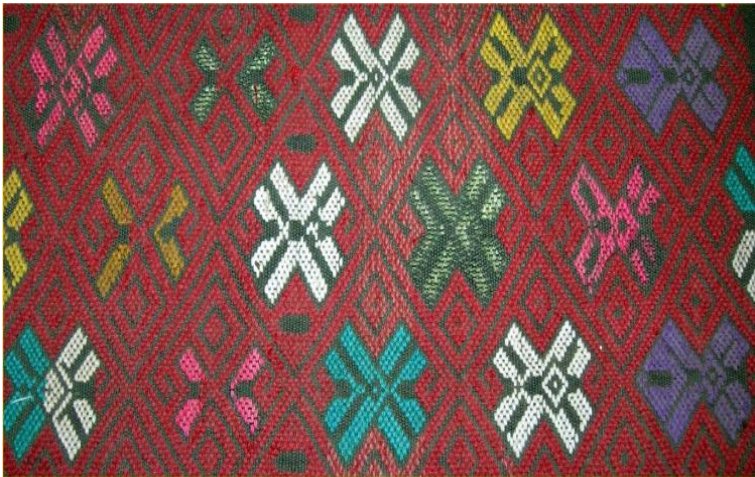
ပင်စိမ်းပွင့်ပုံဒီဇိုင်း