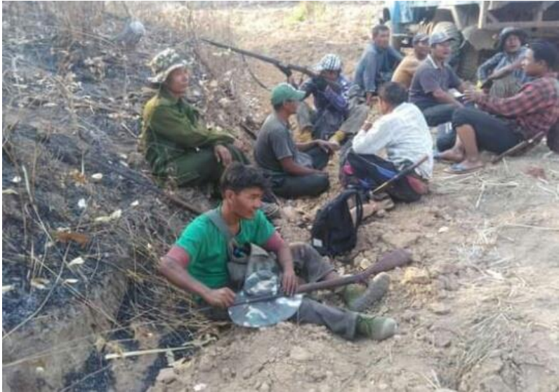
တောကောင်လိုက်ရန် ပြင်ဆင်နေကြပုံ