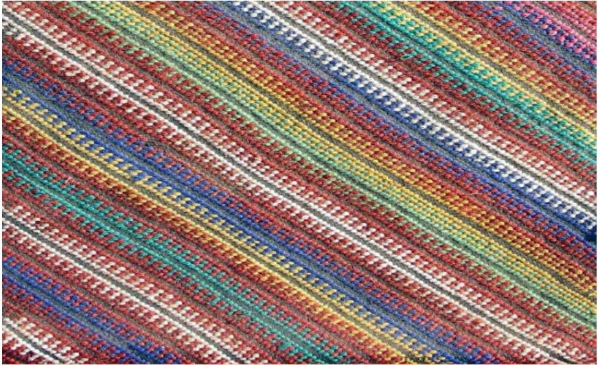
ဝါစော့ပုံဒီဇိုင်း