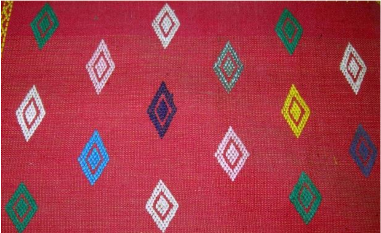
ဖရုံစေ့ပုံဒီဇိုင်း

အဓိက အနီ၊ အစိမ်း၊ ခရမ်း၊ အနက် စသည့်အရောင်များကို အသုံးပြုကြသည်။