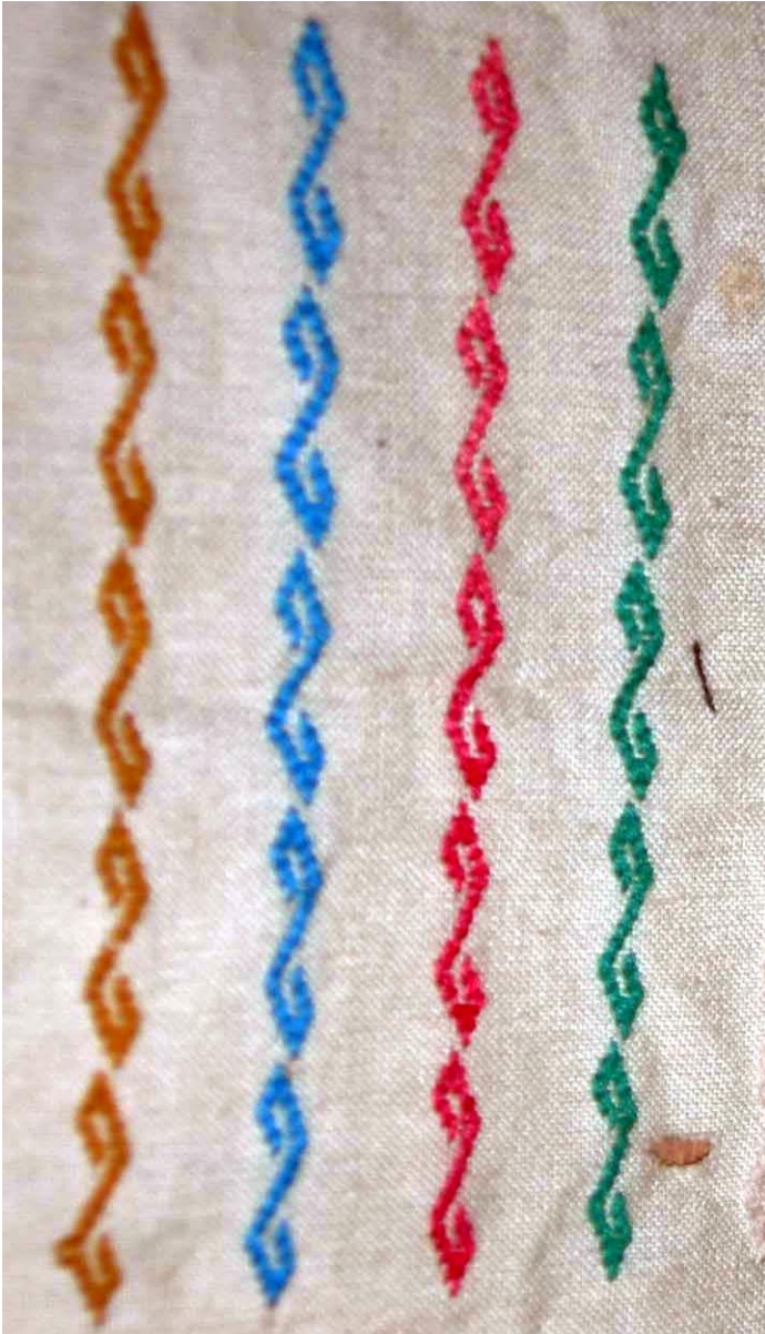
မနောတိုင်ပုံဒီဇိုင်း