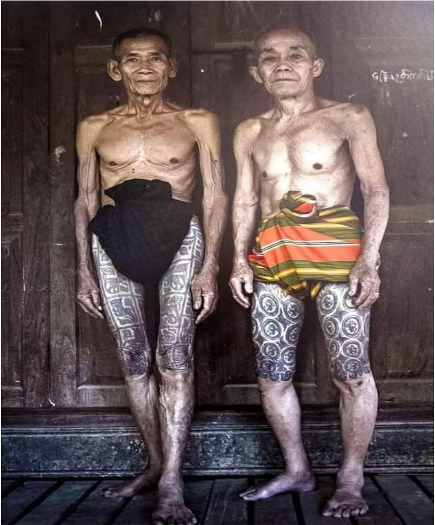
ရှေးခေတ်ကရင်ရိုးရာထိုးကွင်းခလေ့ပုံ