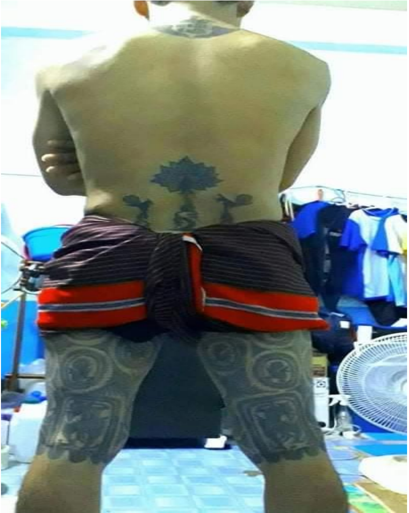
ရှေးခေတ်ကရင်ရိုးရာထိုးကွင်းခလေ့ပုံ