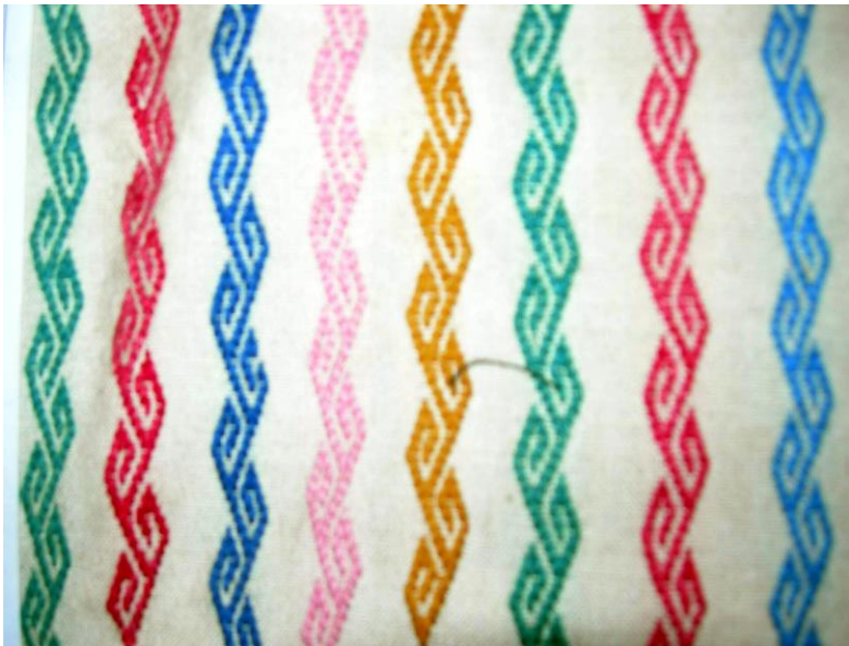
မနောတိုင်ပုံဒီဇိုင်း