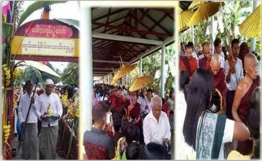
တနင်္သာရီရိုးရာယဉ်ကျေးမှု ခေါသရပ်ပွဲတော်