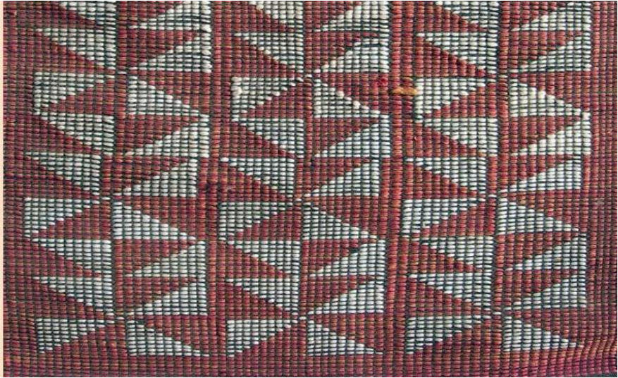
မင်းဘောရွက်