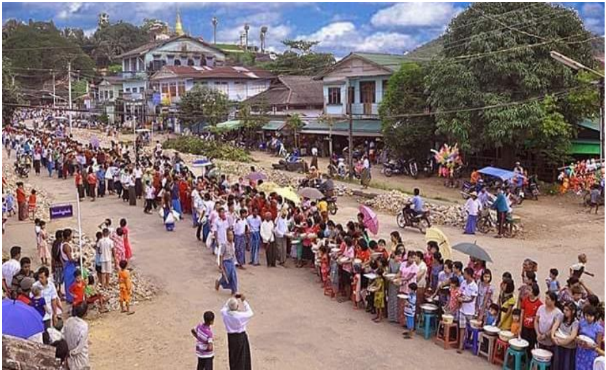
တနင်္သာရီရိုးရာယဉ်ကျေးမှုခေါသရပ်ပွဲတော်မြင်ကွင်း