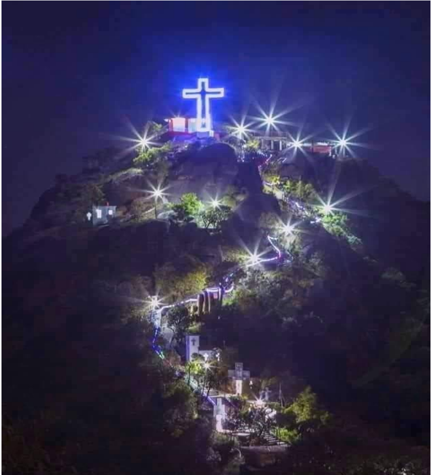
ကရင်ပြည်နယ် သံတောင်ကြီးမြို့မှ နော်ဘူဘောဆုတောင်းတောင်