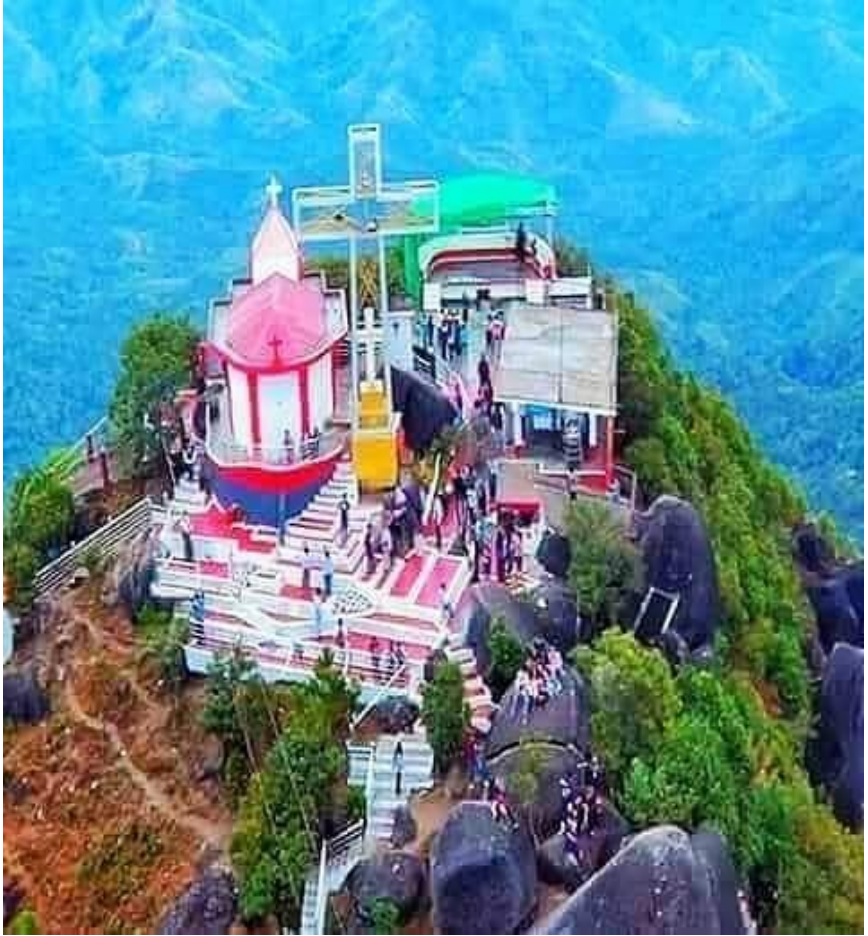
ကရင်ပြည်နယ်သံတောင်ကြီးမြို့မှ နော်ဘူဘော ဆုတောင်းတောင်