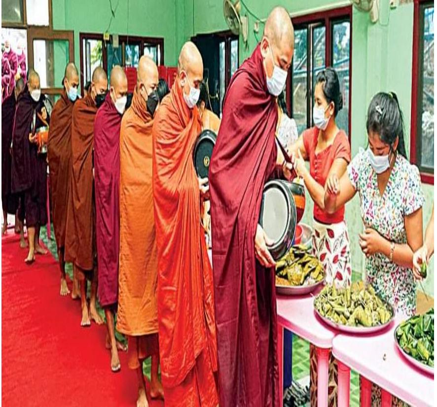
ဆရာတော်၊ သံဃာတော်များအား ခေါသရုပ်မုန့်မျိုးစုံ လောင်းလှူခြင်း