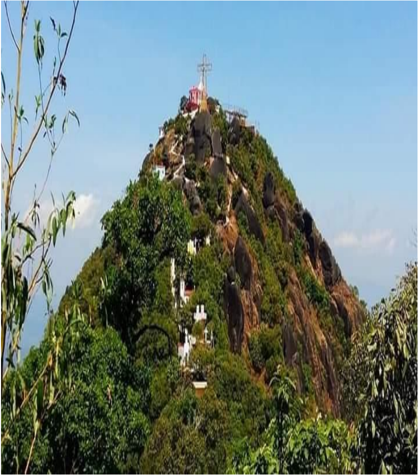
ကရင်ပြည်နယ် သံတောင်ကြီးမြို့မှ နော်ဘူဘော ဆုတောင်းတောင်