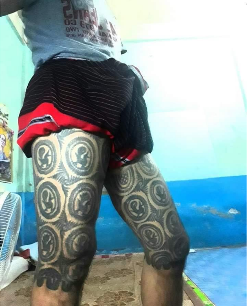
ရှေးခေတ်ကရင်ရိုးရာ ထိုးကွင်းခလေ့ပုံ