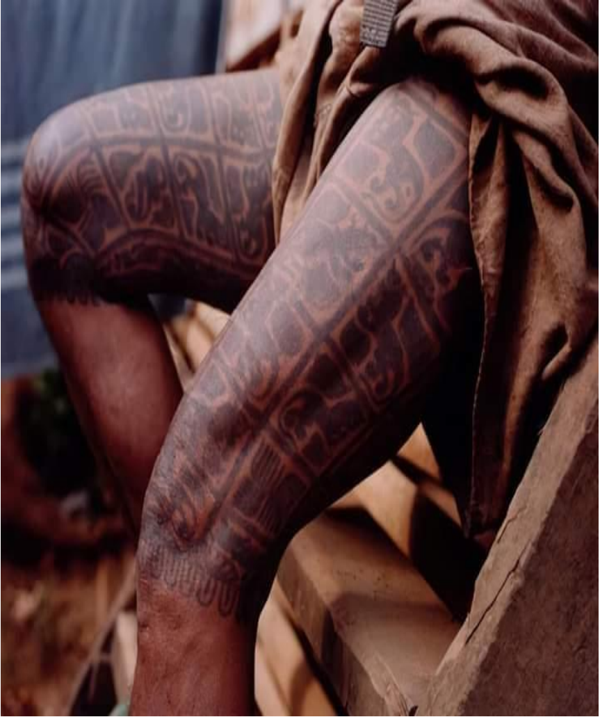
ရှေးခေတ်ကရင်ရိုးရာထိုးကွင်းခလေ့ပုံ